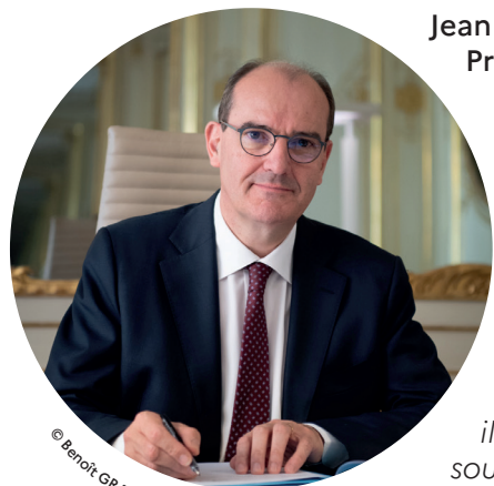
Jean CASTEX, Premier ministre

« Vous le savez: je suis convaincu que la réponse aux défis de notre société passe par les territoires. C'est pourquoi j'ai tenu à ce que les acteurs locaux soient pleinement associés, non seulement à la mise en œuvre des politiques publiques de sécurité, mais également à leur élaboration. Ensemble, nous permettrons à l'État de se réaffirmer là où il avait pu donner le sentiment de reculer sous le poids des trafics et de la violence. »